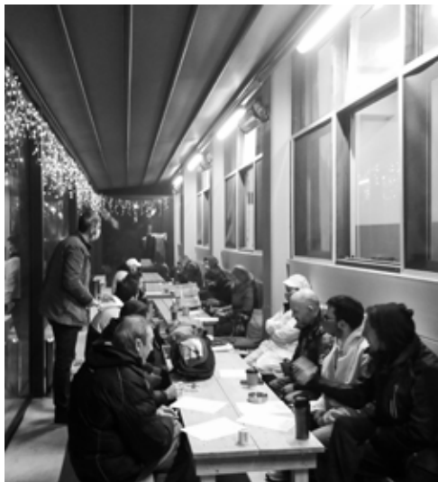
Απο περιοδεία του ΕΚΙ στην ΠΙΝΔΟ