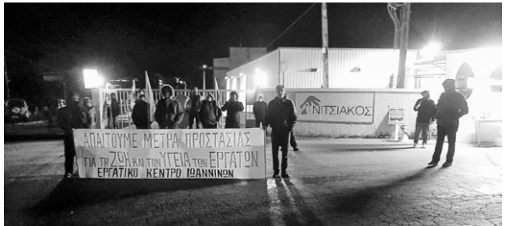
Απεργιακή φρουρά ΝΙΤΣΙΑΚΟΣ 26 Νοέμβρη