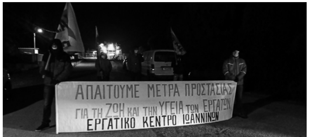
Απεργιακή φρουρά στην ΠΙΝΔΟ 26 Νοέμβρη