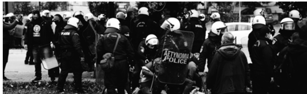
Από την καταστολή στις 17 ΝΟΕΜΒΡΗ 2020

Το ΕΚΙ είναι καρφί στο μάτι της εργοδοσίας. Είναι γελασμένοι αν νομίζουν ότι θα σταματήσουν τη δράση του, την ανυποχώρητη πάλη για τα δικαιώματα και τις σύγχρονες ανάγκες των εργαζομένων.