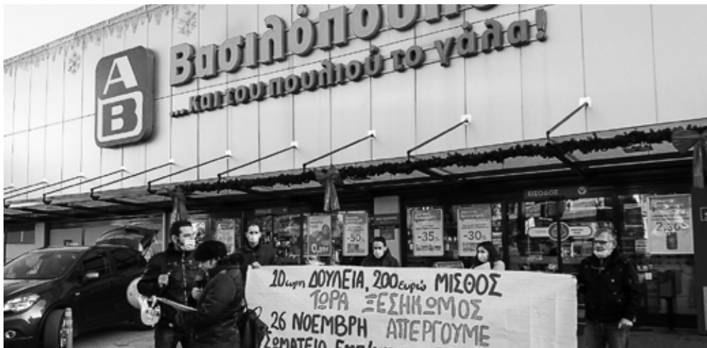
Σωματείο Ιδιωτικών Υπαλλήλων- Προετοιμασία της απεργίας