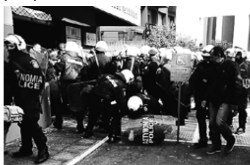
Από την καταστολή στο MARKET IN 2017

Στις 17 Νοέμβρη, και στην Πανελλαδική Απεργία στις 26/11 ακυρώσαμε στην πράξη τις απαγορεύσεις τους, το στόχο να επιβληθεί «σιγή νεκροταφείου». Όταν ο λαός δεν εναποθέτει τις ελπίδες του σε κυβερνητικές αλλαγές, αλλά διεκδικεί αγωνιστικά το δικό του, μόνο τότε αποσπά κατακτήσεις, αποτρέπει τα χειρότερα.