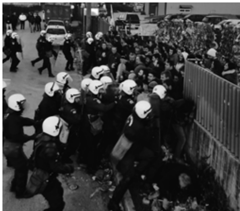
Από την καταστολή στην ΑΝΑΚΥΚΛΩΣΗ 2015

Αυτή η πολιτική εκδηλώθηκε πιο έντονα μετά της 17 Νοέμβρη και στην πόλη μας. Κυβέρνηση και αστυνομικές δυνάμεις επιχείρησαν να διαλύσουν την συμβολική συγκέντρωση του Εργατικού