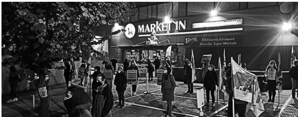
Απεργιακή φρουρά στο MARKET - IN 26 Νοέμβρη